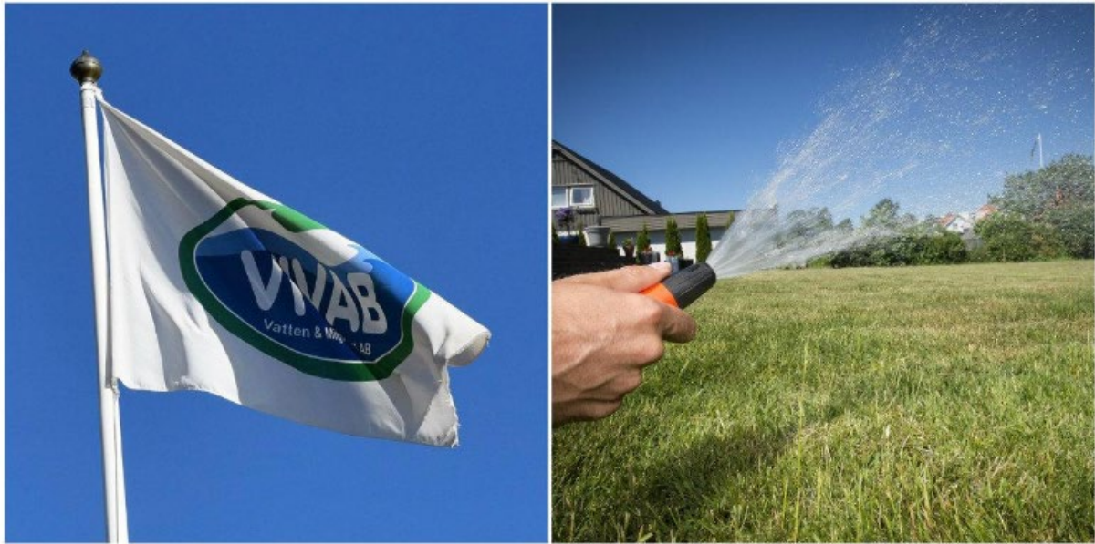
Vivab fortsätter att satsa miljoner på vattenförsörjning.